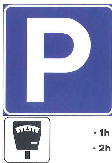
Figura 1. Segnaletica verticale della sosta a pagamento

Le aree di sosta a pagamento sono identificate con la segnaletica orizzontale di colore blu e concentrate solamente nella Zona 1.