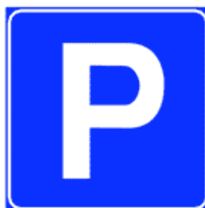
Figura 3. Segnaletica verticale della sosta libera

La sosta libera è identificata dalla segnaletica di colore bianco e dall'apposita segnaletica verticale.