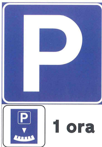
Figura 2. Segnaletica verticale della sosta limitata

Tale tipologia presenta limiti temporali, identificati dall'apposita segnaletica verticale (zona disco orario).